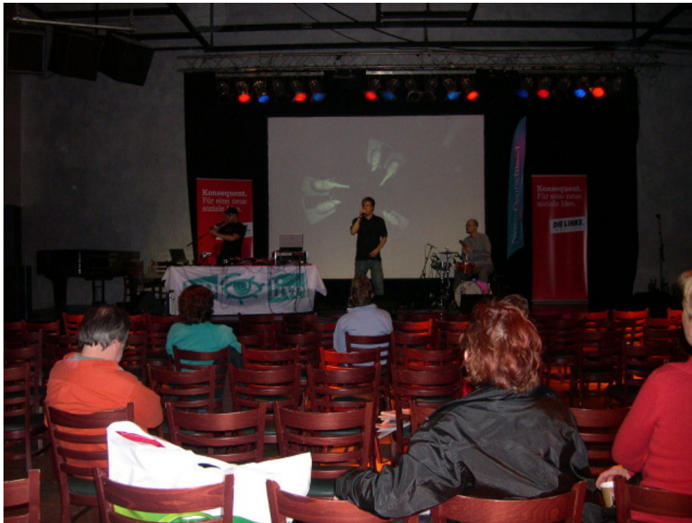
Konzert der „Bandbreite“.

Eine kritische Teilhabe wird angesichts solcher Positionen natürlich nicht ausreichen. Andreas Weibel ruft in seiner Funktion als Vorsitzender des „Club Voltaire“ dazu auf, „den Club Voltaire als Ort der Aufklärung und des Antifaschismus“ zu verteidigen.