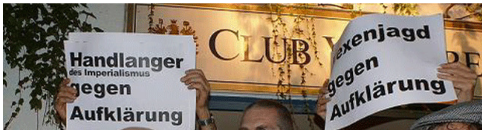
Position der „Arbeiterfotografie“ über ihre Kritiker_innen...

Hier wird ein Feindbild formuliert: Denn zur Verschwörungstheorie über die von Mossad, BND und CIA gesteuerten Kritiker_innen gehört auch in allen (!) Kritiker_innen vermeintliche oder tatsächliche „ Anti-Deutsche “ zu erkennen. Diese werden konsequent mit dem hässlichen Schimpfwort „ Anti-Linke “ belegt. In ihnen sieht die Gruppe „ Arbeiterfotografie “, eine „ ernste Gefahr “. So hetzen Mitglieder_innen der „ Arbeiterfotografie “ in einem „ Schwerpunkt “ der „ Jungen Welt “ (s. Screenshot ).