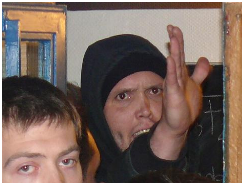
Veranstaltungsgegner am Eingang zum Club Voltaire

Das ist nicht mit hundertprozentiger Gewißheit zu sagen. Mit Sicherheit waren aber zahlreiche Personen aus dem so genannten anti-deutschen Spektrum dabei. Das sind - einfach gesagt - Leute, die sich gegen die Großmachtinteressen Deutschlands richten, aber die Kriegsverbrechen Israels und der USA rechtfertigen. Über die Frage, was sie dazu bringt, auf der einen Seite gegen gefährliche Entwicklungen Front zu machen, auf der anderen Seite sich aber zum Erfüllungsgehilfen von imperialen Interessen und den damit verbundenen Verbrechen machen zu lassen, läßt sich nur spekulieren. Denkbar ist, daß es viele Mitläufer gibt. Denkbar ist aber auch, daß bezahlte Kräfte darunter sind, die im Auftrag handeln.